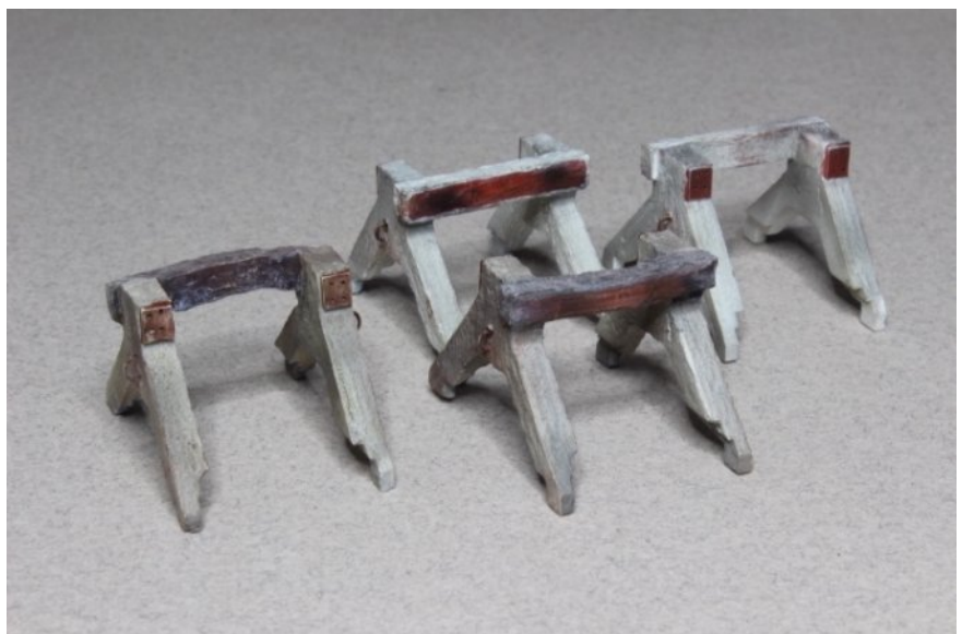
Heurtoirs décorés by Gérard